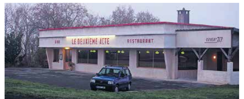
Za otvoritveni film festivala so, kot že nekaj zadnjih let, izbrali francoski film, in sicer komedijo Le Deuxieme Acte , ki bo hkrati predvajana po vsej Franciji. ✎ Canski filmski festival

11. aprila. Na festivalu naj bi svetovno premiero doživel zadnji del postapokaliptične franšize Pobesnelega Maksa v režiji Georgea Millerja, tokrat z naslovom Furiosa ; film bodo predvajali zunaj konkurence. Po neuradnih informacijah naj bi se v Cannes vrnil režiser Botra Francis Ford Coppola, in sicer s svojim dolgo pričakovanim epom Megalopolis z Adamom Driverjem v glavni vlogi. Na festivalu naj bi prikazali tudi najnovejši skupen projekt Emme Stone in režiserja Yorgosa Lanthimosia Kinds of Kindness . ✕ sta