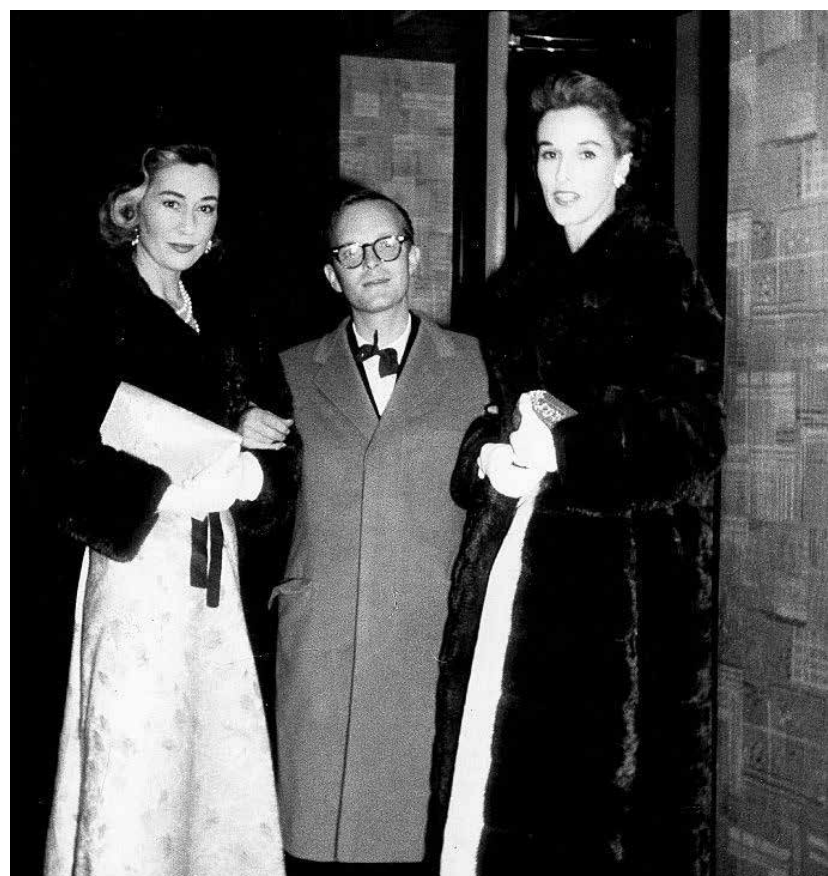
Gloria Guinness (levo) in Barbara Babe Paley (desno). Capotejevi labodki, s katerima si je bil najbližje in ki po izidu poglavja z njim nista nikoli več spregovorili.

Leta 2021 je pisatelj Laurence Leamer izdal roman Capote's Women: A True Story of Love, Betrayal and a Swan Song for an Era (Capotejeve ženske: Resnična zgodba o ljubezni in izdaji ter labodji spev nekega obdobja), v katerem natančno popiše življenje labodk. Poglobi se v njihovo življenje, prouči in predstavi vsa dejstva ter prikaže, kako se je mednje vpletel Capote in kakšno moč in vlogo je imel v njihovem življenju. Na neki način je dokončal Capotejevo nenapisano delo, vendar brez vsakršnih tračev in z biografsko natančnostjo. Marca 2024 pa je na male ekrane prišla serija znanega režiserja Ryana Murphyja z naslovom Feud: Capote vs. The Swans , ki je nastala po knjižni predlogi. Capotejeve labodke uprizorijo velike igralke, kot so Naomi Watts, Diane Lane, Demi Moore in druge. Truman Capote je sedem let po izidu zloglasnega in škandaloznega poglavja umrl. Vse od romana Hladnokrvno iz leta 1966 pa do smrti ni napisal ničesar več. Toda skupaj s svojimi labodkami se je zapisal v zgodovino in ustvaril enega največjih literarnih škandalov, o katerem govorimo še danes. ✕